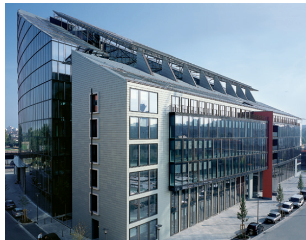
Oberfinanzdirektion Frankfurt am Main

Während der theoretische Teil an der Dualen Hochschule Baden-Württemberg in Mannheim stattfindet, absolvierst Du die Praxis Deines dualen Studiums bei der Oberfinanzdirektion in Frankfurt am Main.